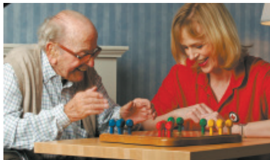
FED Alltagsbegleiter kümmern sich auch um die Freizeitgestaltung an Demenz erkrankten Menschen.